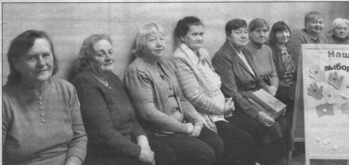
Участницы клуба «Подруга» активно поддерживают инициативу по ремонту библиотеки

Светлана ГЕЦМАН