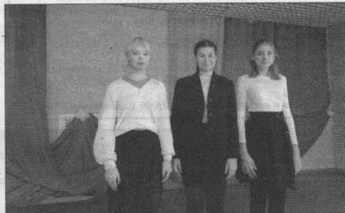
Победители школьного этапа Всероссийского конкурса юных чтецов «Живая классика — 2023»